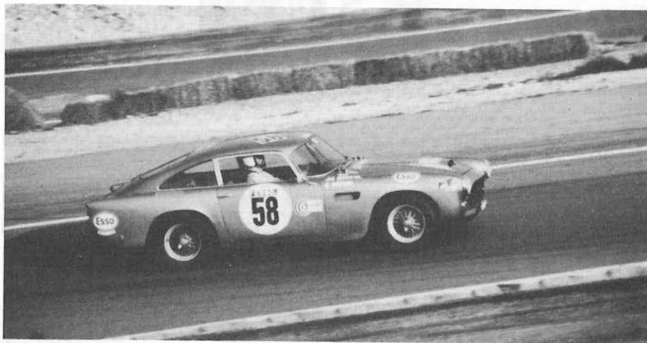
J-M. Santal négociant la cuvette à Dijon

En 1977, toute l'équipe sera naturellement présente aux bords des pistes, probablement avec les mêmes véhicules.