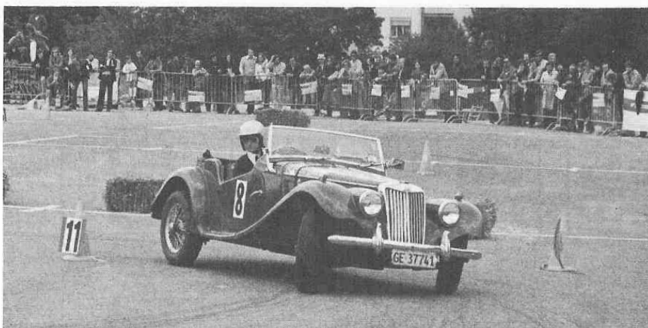
Claudine Perrin termine sa 4ème saison avec son MG TF 1500